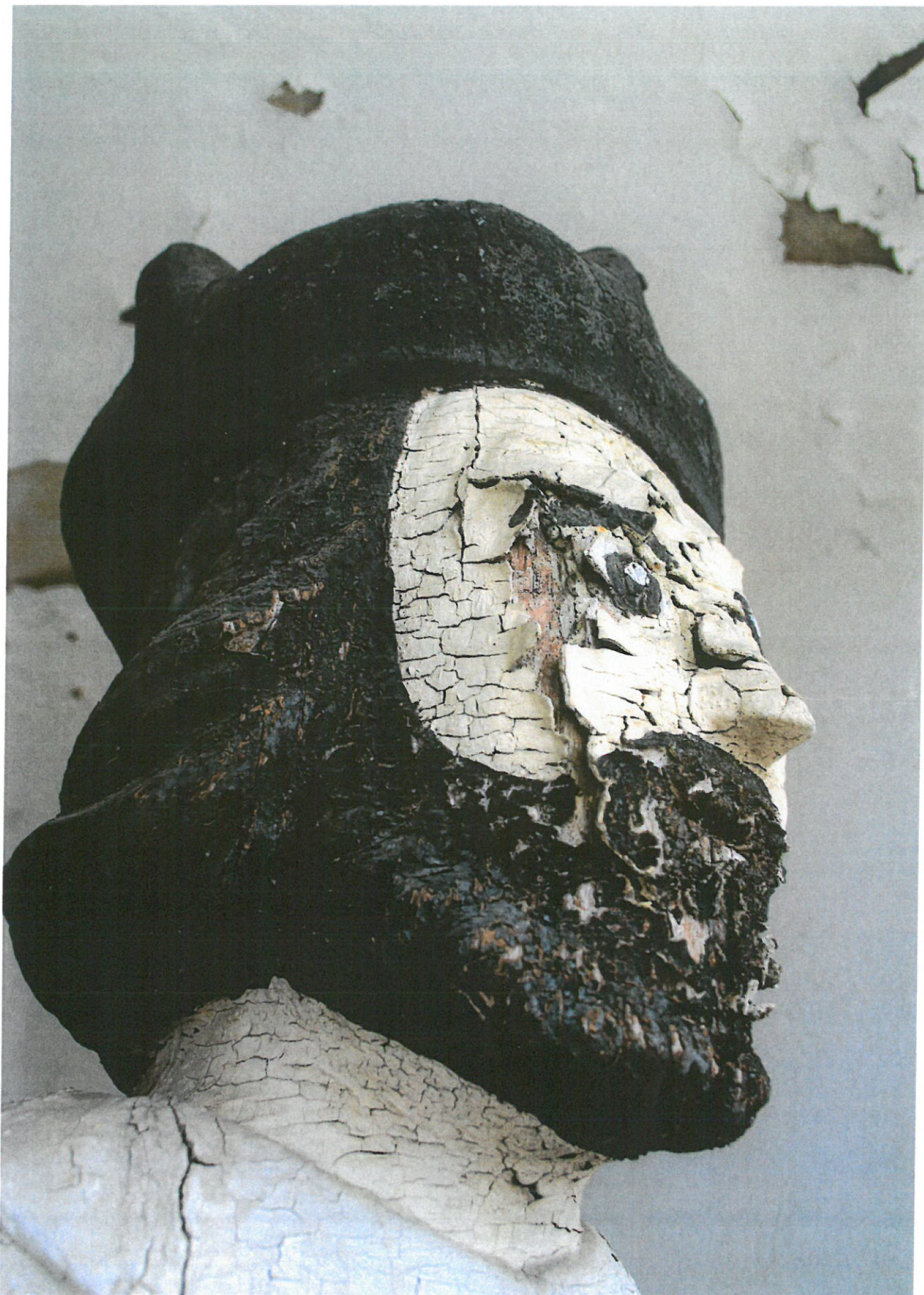
ZDJ.2 DROHICZYN. RZEŻBA ŚW. JANA NEPOMUCENA Z KAPLICZKI PRZYDROŻNEJ. GŁOWA. W ODSPOJENIACH PRZEMALOWAŃ WIDOCZNE ŚLADY ORYGINALNEJ POLICHROMII