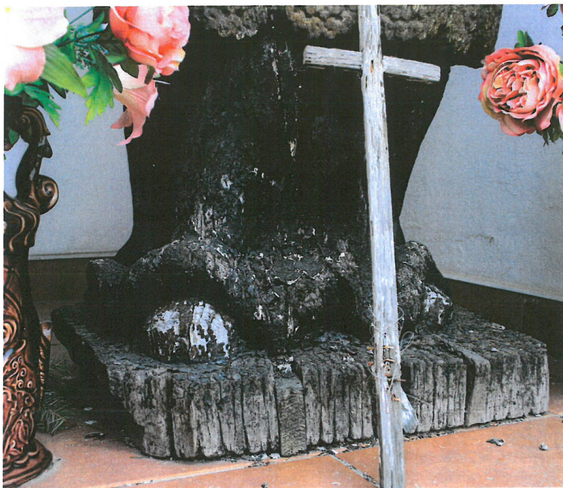
ZDJ .5 DROHICZYN. RZEŻBA ŚW. JANA NEPOMUCENA Z KAPLICZKI PRZYDROŻNEJ. GŁĘBOKIE SPĘKANIA PODSTAWY