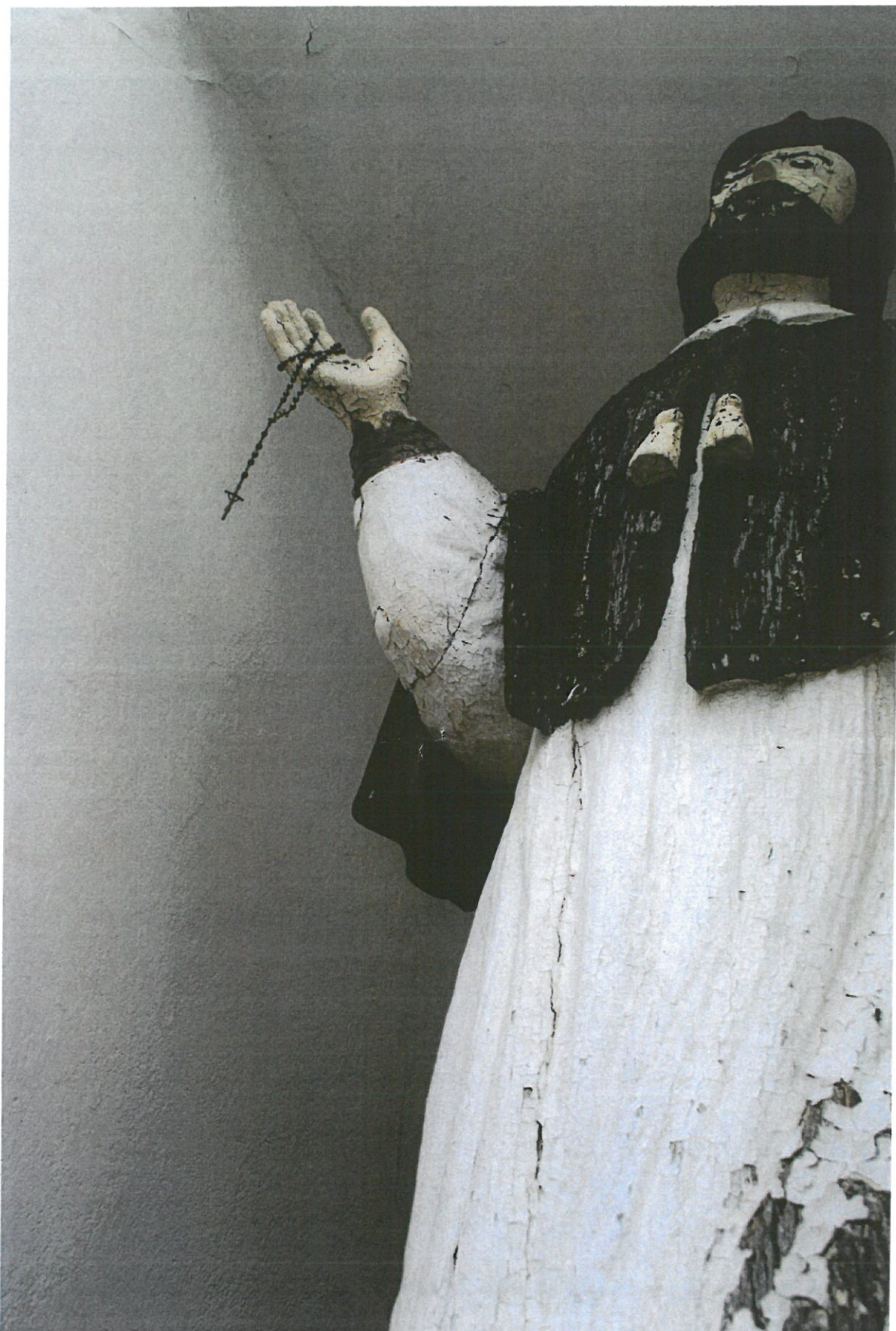
ZDJ. 5 DROHICZYN. RZEŻBA ŚW. JANA NEPOMUCENA Z KAPLICZKI PRZYDROŻNEJ. WIDOCZNE ŁĄCZENIA ELEMENTÓW RZEŻBY I PIONOWE PĘKNIĘCIA