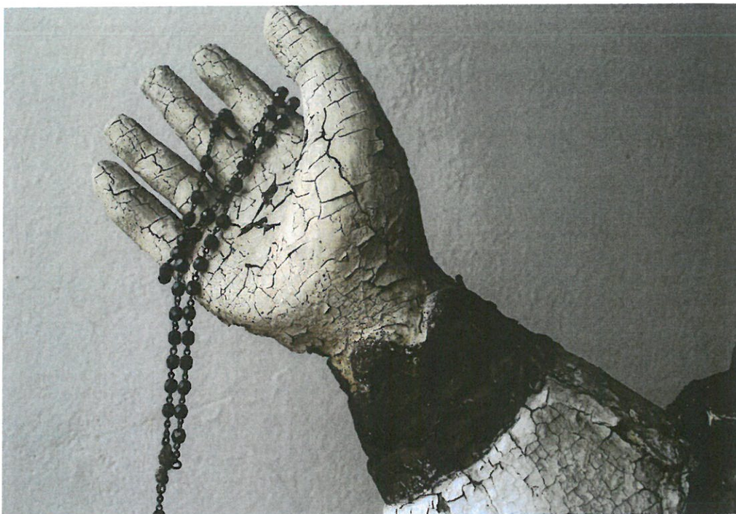
ZDJ 6 DROHICZYN. RZEŻBA ŚW. JANA NEPOMUCENA Z KAPLICZKI PRZYDROŻNEJ. PRAWA DŁOŃ