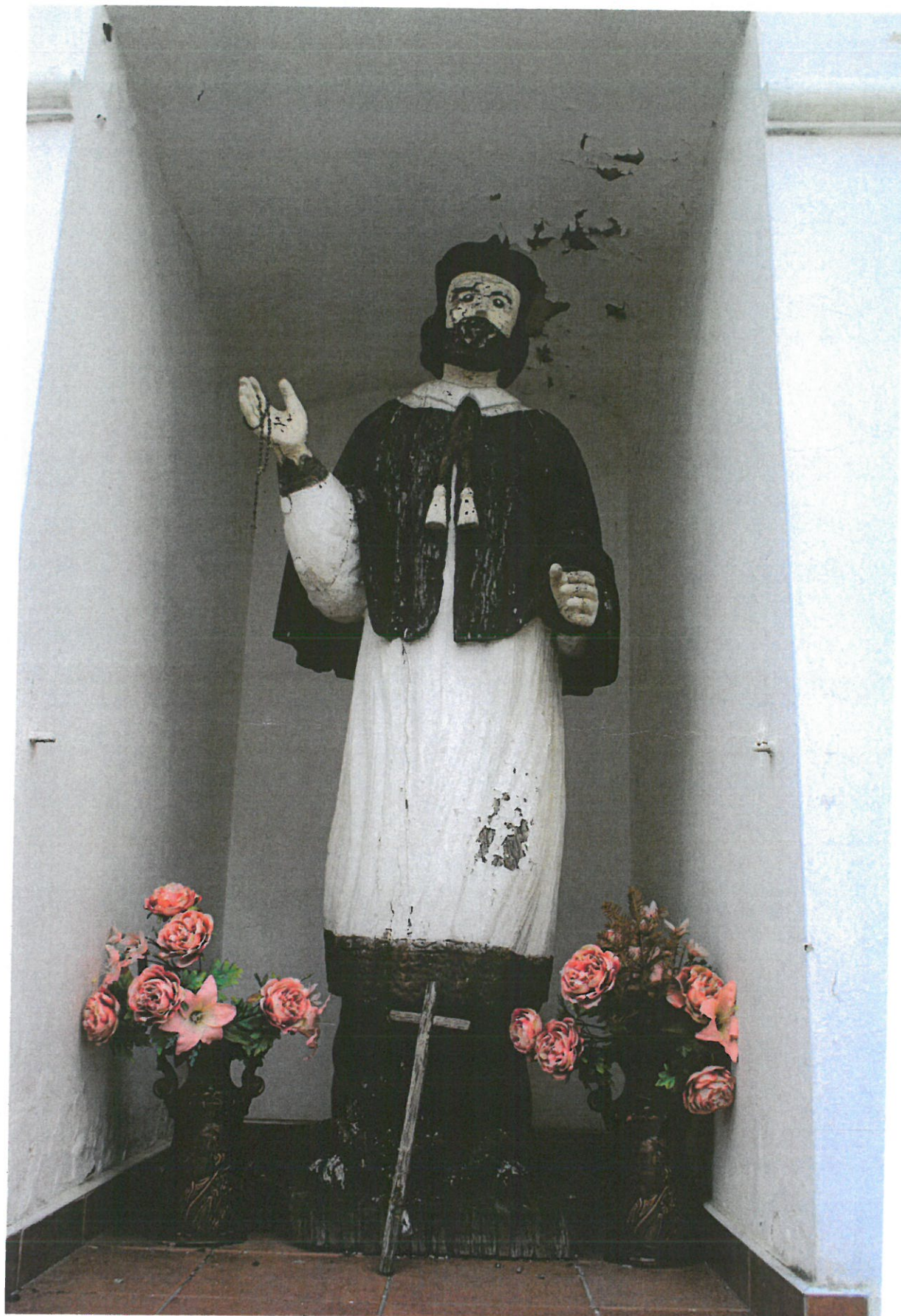
ZDJ.1 DROHICZYN. RZEŹBA ŚW. JANA NEPOMUCENA Z KAPLICZKI PRZYDROŻNEJ.