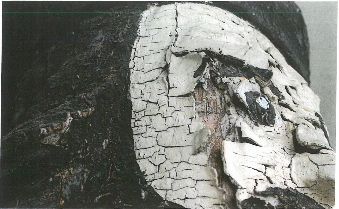
ZDJ .3 , 4 DROHICZYN. RZEŻBA ŚW. JANA NEPOMUCENA Z KAPLICZKI PRZYDROŻNEJ. DETAL. W ODSPOJENIACH PRZEMALOWAŃ WIDOCZNE ŚLADY ORYGINALNEJ POLICHROMII